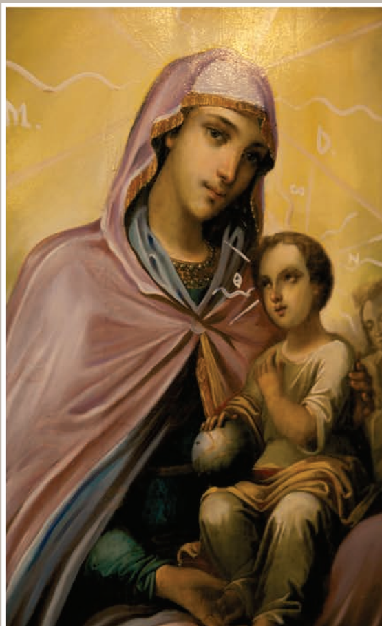
Detaliu Pictură-Maica Domnului și Pruncul