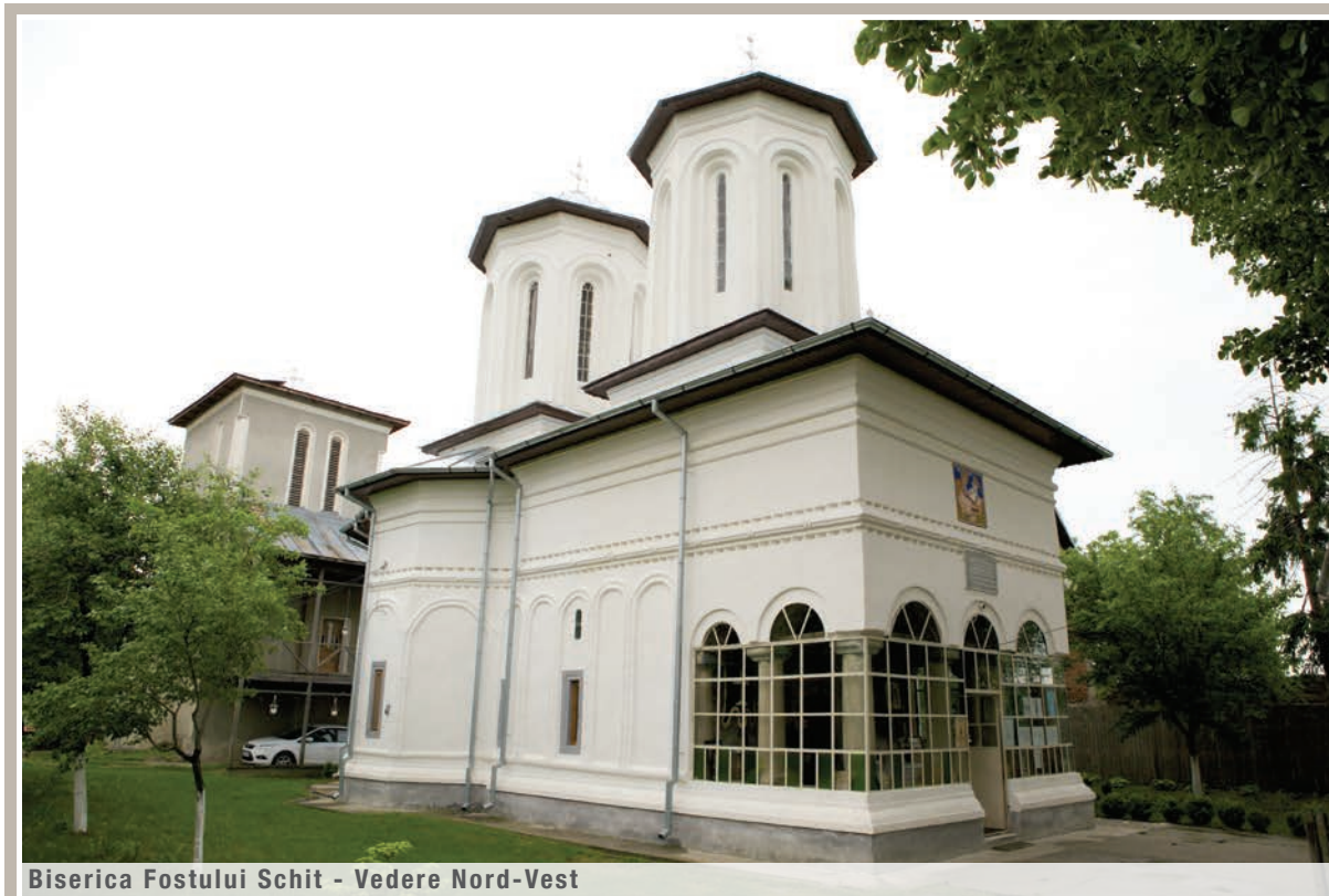
Biserica Fostului Schit - Vedere Nord-Vest